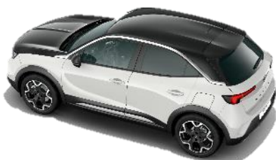
Čierna strecha Diamond Black (JD20) – 500 € / GS&Ultimate štandard Čierna kapota Karbon Black (7N02) – GS/Ultimate 250 €