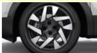
17" dvojfarebné disky z ľahkých zliatin s 5 dvojitými lúčmi (ZHP8/T9)