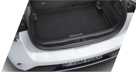
Vanička do batožinového priestoru, obojstranná Vanička s protišmykovou úpravou. Vrchná časť z čierneho koberca, spodná časť z čistiteľnej gummy. Vysoký, stabilný okraj (30 mm) s nápisom Mokka. Číslo dielu: 9837878380 Cenniková cena: 106,81 €