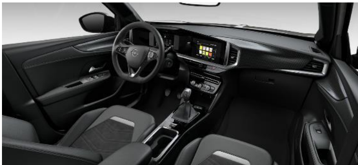
Čalúnenie Ultimate Alcantara, čierne Jet Black, strieborný dekor, čierny strop (SHFT) GS – 700 € / Ultimate – štandard