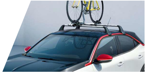
Strešný nosič bicykla Thule "Expert 298" Číslo dielu: 9858801180 Cenniková cena: 327,74 €