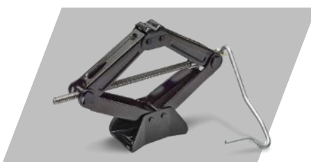
Súpravu náradia a zdvihák Číslo dielu: 9842716180 Cenniková cena: 50 €