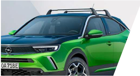
Priečne strešné hliníkové nosiče Sada 2 ks. aerodynamický hliníkový nosič, ľahká inštalácia, uzamykateľné uzávery, nosnosť strechy 75 kg. Číslo dielu: 9841125680 Cenniková cena: 343,02 €