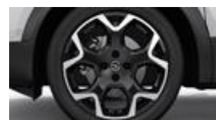
18" dvojfarebné disky z ľahkých zliatin s 5 lúčmi (ZHQ1)