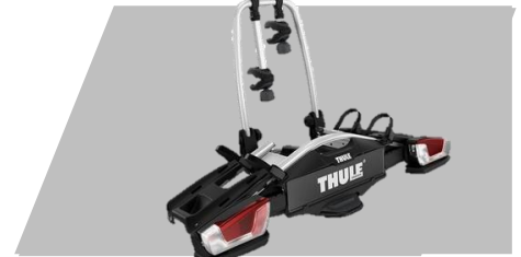
Nosič pre 2 bicykle na ťažné zariadenie Jednoduchá montáž bicyklov vďaka odnímateľným fixačným ramenám, nosnosť 46kg Číslo dielu: 1629425880 Cenniková cena: 715,58 €