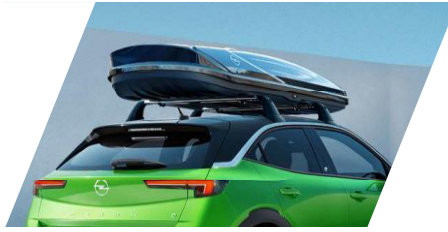
Strešný box Thule "Ocean 80," Elegantný strešný box praktického formátu. Rozmery: 133 x 86 x 37 cm. Objem: 320 l Číslo dielu: 1662444280 Cenniková cena: 289,37 €