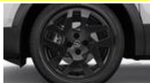
17" čierne disky z ľahkých zliatin s 5 dvojitými lúčmi (ZHP9)