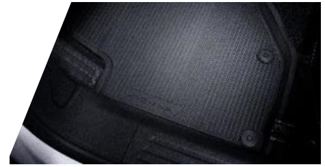
Súprava gumových tvarovaných kobercov -4ks Ochránia podlahu pred vlhkosťou, snehom a nečistotami. Nápis Mokka vpredu Číslo dielu: 1671152380 Cenniková cena: 67,63 €