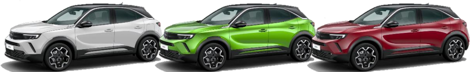
Bielá Arktis (WPP0) 0 €