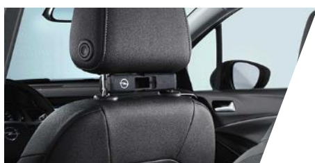
FlexConnect adaptér Číslo dielu: 9834351380 Pôvodná cena: 59 €