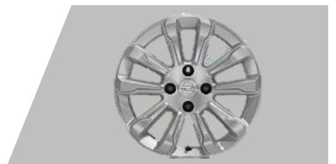
Disk z ľahkej zliatiny 16" strieborný Číslo dielu: 9835097280 Cenniková cena: 207,08 €