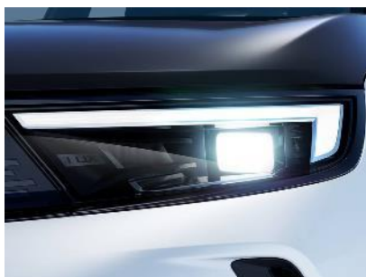
Intelli-Lux LED® pixelové svetlo

Opel Pure Panel® s najnovšími technológiami, plne digitálny 12-palcový informačný displej