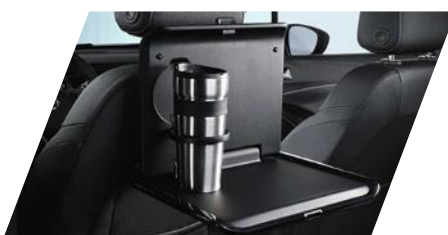
FlexConnect sklápny stolček potrebné objednať FlexConnect adaptér Číslo dielu: 9834352180 Cenniková cena: 177,11 €