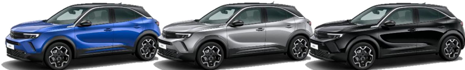
Modrá Voltaik (AVM0) 550 €