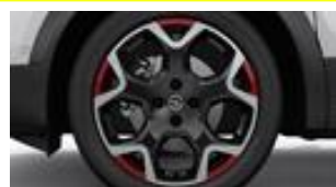
18" dvojfarebné disky z ľahkých zliatin s 5 lúčmi a červenými prvkami (ZHA3)