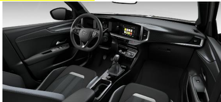
Čalúnenie kombinácia vinyl/látka GS, čierne Jet Black so strieborným dekorom, čierny strop (S9FZ) – GS – 0 €