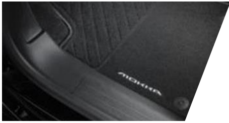
Súprava tvarovaných kobercov vpredu&vzadu Koberce Economy z extrémne odolného materiálu. Jemný čierny okraj a Mokka logo vpredu Číslo dielu: 1671152780 Cenniková cena: 64,8 €