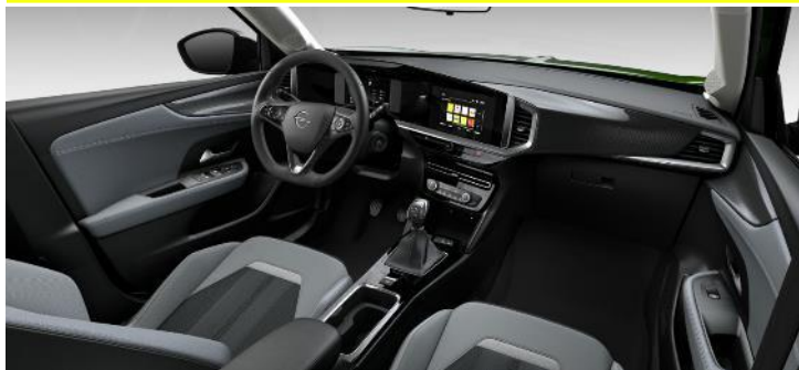
Čalúnenie kombinácia vinyl/látka Elegance, čierne Jet Black, šedý strop (S9FY) – Edition – 0 €