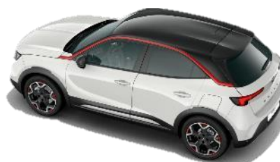
Sada Red – červené lišty okolo bočných okien, 18" dvojfarebné disky z ľahkej zliatiny Diamond Cut s 5 lúčmi a červenými prvkami (S9FJ) GS 350 €