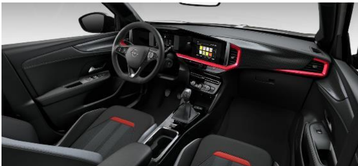
Sada Red – Čalúnenie kombinácia vinyl/látka GS, čierne Jet Black s červeným dekorom, čierny strop (S9FJ) – GS – 350 €