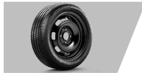
Rezervné dojazdové koleso 16" Súpravu náradia sa objednáva samostatne. Číslo dielu: 9836491380 Cenniková cena: 160 €