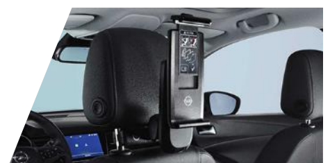
FlexConnect držiak tabletu (univerzálny) potrebné objednať FlexConnect adaptér Číslo dielu: 9834352980 Cenniková cena: 231,23 €