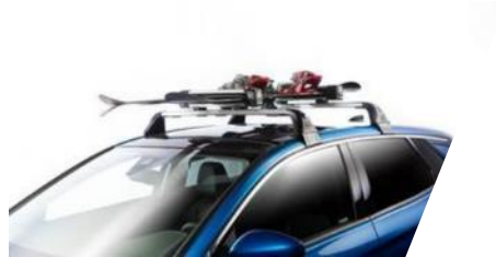
Nosič lyží/snowboardov Thule 7324, 4 páry lyží Číslo dielu: 9858802280 Cenniková cena: 323,62 € * v ponuke aj pre 6 párov